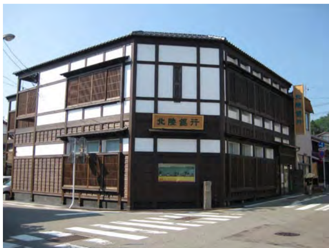
北陸銀行八尾支店(施行後)