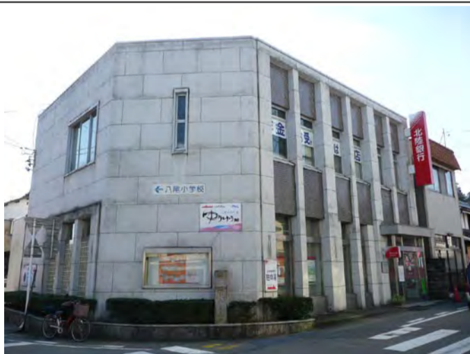
北陸銀行八尾支店(施行前)