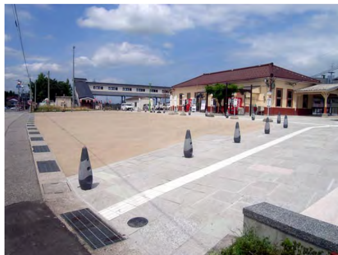
越中八尾駅前広場整備